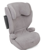
Schonbezug Gray Flannel A1903TBGFL000