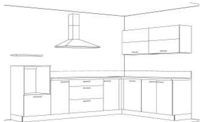
Werbeküche 305 x 215 cm