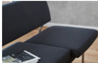
Sitzvorzug im Bankelement