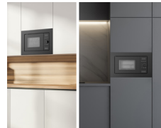
Einbau- und Unterbaugerät