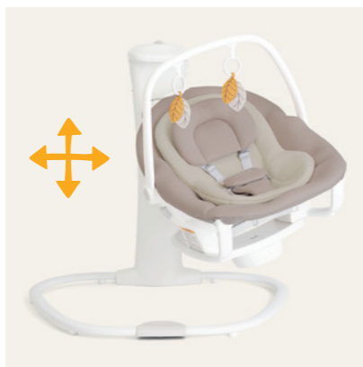
beruhigende Schaukelfunktion in 2 Richtungen