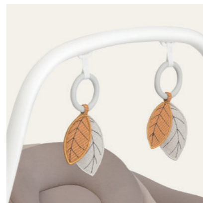
schwenkbarer Spielbügel mit 2 Greifspielzeugen