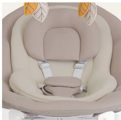
weiche Neugeborenenauflage für die Allerkleinsten