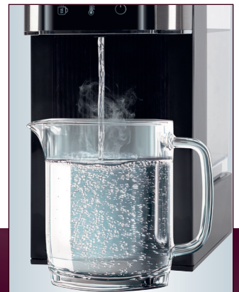
Auch für große Gefäße geeignet (abnehmbarer Auffangbehälter)