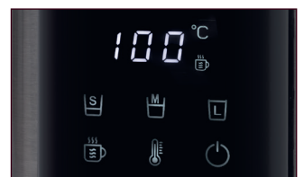
Multifunktions-LED-Display mit Sensor Touch-Bedienung und Quick Select

Ideal geeignet für die Zubereitung verschiedener Teesorten, z. B. Matcha Tee, Grüner Tee und Jasmin Tee