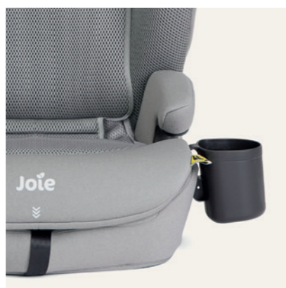
beidseitig verwendbarer Getränkehalter