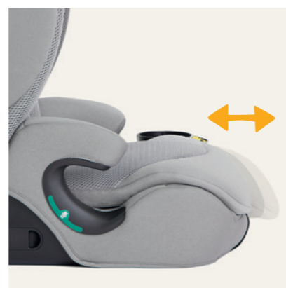
3 einstellbare Sitztiefen je nach Beinlänge