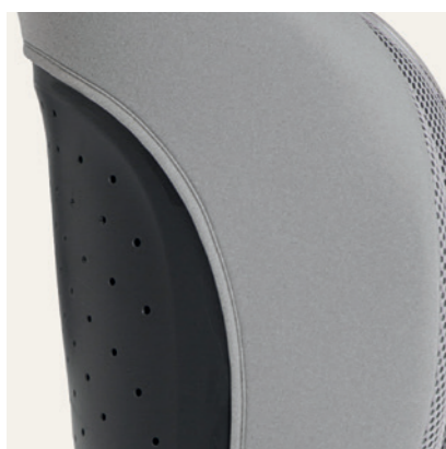
Rückenlehne mit Belüftungslöchern zur Luftzirkulation