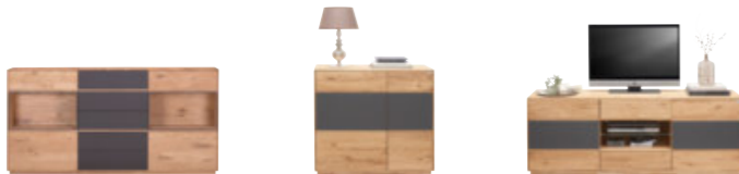
Sideboard B/H/T: ca. 177 x 89 x 42 cm inkl. Beleuchtung