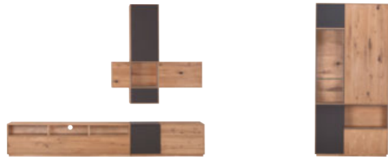
Wohnwand B/H/T: ca. 265 x 205 x 50 cm inkl. Beleuchtung