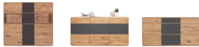
Highboard B/H/T: ca. 154 x 138 x 42 cm inkl. Beleuchtung