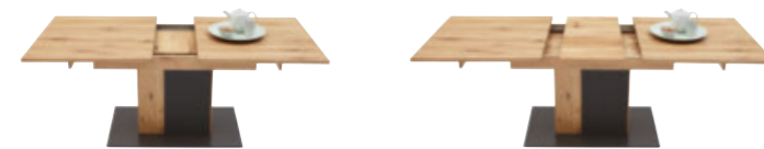
Esstisch ausziehbar L/B/H: ca. 160 (200) x 90 x 75 cm

Durch innenliegende Einlegeplatte um ca. 40 cm verlängerbar.