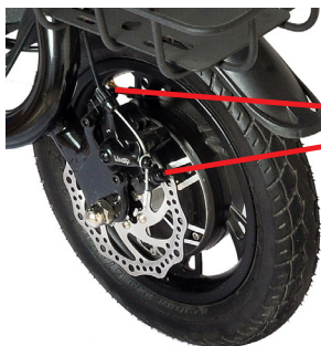
Schrauben der Bremssattelbefestigung