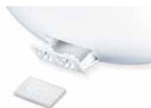
Zur Anwendung mit Aromaölen (inkl. 15 Aromapads)