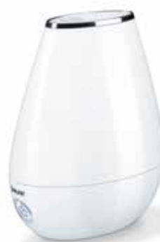
Nachtmodus: flüsterleiser Betrieb und Bedienteil ohne störende Beleuchtung