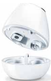
Abnehmbarer Wassertank, 2 l