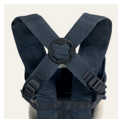
überkreuzte Schultergurte für angenehmen Tragekomfort