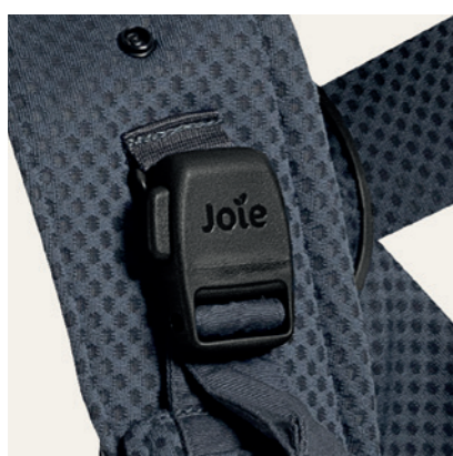
automatisch schließende Magnetverschlüsse