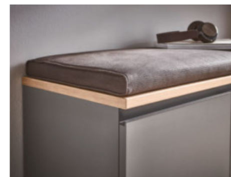
Garderobenbank mit funktionalem Sitzkissen

Sorrent erfüllt Ihre hohen Ansprüche nach qualitativen wie kreativen Einrichtungslösungen für Ihre Diele. So werden Schuhschränke und -kommoden, Garderobenpaneele, Dielenschränke, Garderobenbank und Spiegel nach hohen Kriterien hinsichtlich Komfort, Material und Funktionalität für Sie gefertigt. Das geradlinige Design findet sich in jedem Möbelstück konsequent wieder. Stellen Sie sich Ihr persönliches Garderobenprogramm zusammen und freuen Sie sich auf ein behagliches und modernes Entree.