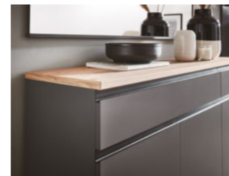
Schuhschrank mit Balkeneiche-Oberboden