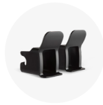
ISOFIX EINBAUHILFEN 50054002