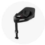
BASE G3 526001366