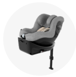
SOMMERBEZUG GRAU 522004762