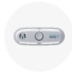
SENSORSAFE 4-IN-1 KIT 521002899