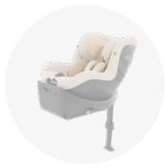
NEUGEBORENEN EINLAGE BLCK 524001745 ALBE 526002862