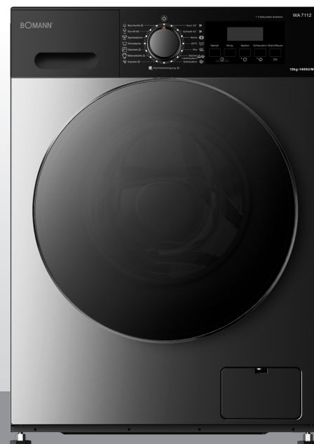
Waschmaschine WA 7112