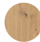
FRONT Artisan Eiche Nachbildung