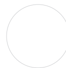
FRONT Weiß Hochglanz