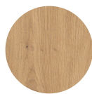
KORPUS Artisan Eiche Nachbildung

Metalleiste zur Verschraubung der Arbeitsplatte