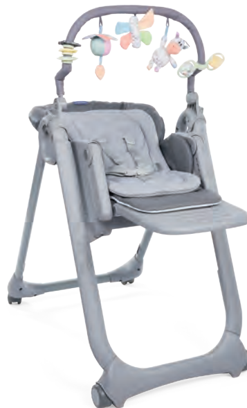
Art.-Nr. 06 079502 210 000 GRAPHITE