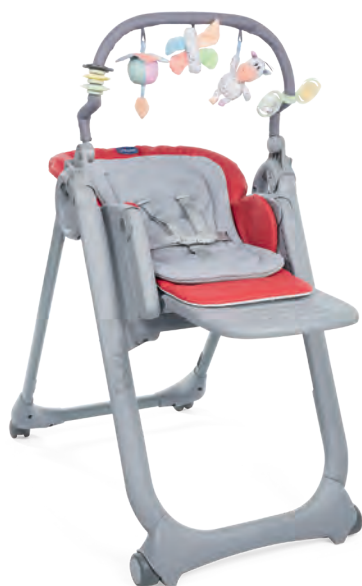
Art.-Nr. 07 079502 300 000 SCARLET