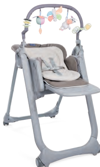
Art.-Nr. 07 079502 850 000 COCOA