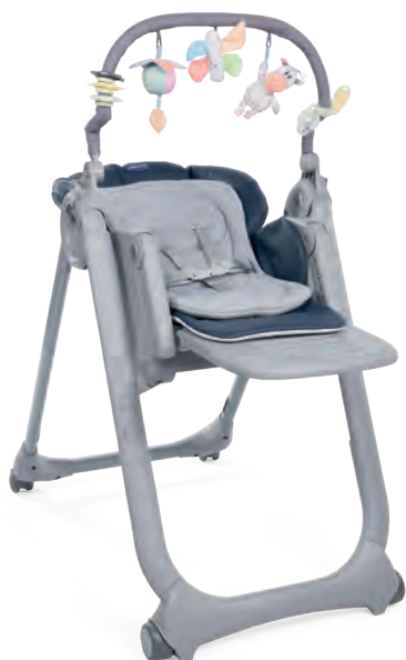
Art.-Nr. 05 079502 390 000 INDIA INK