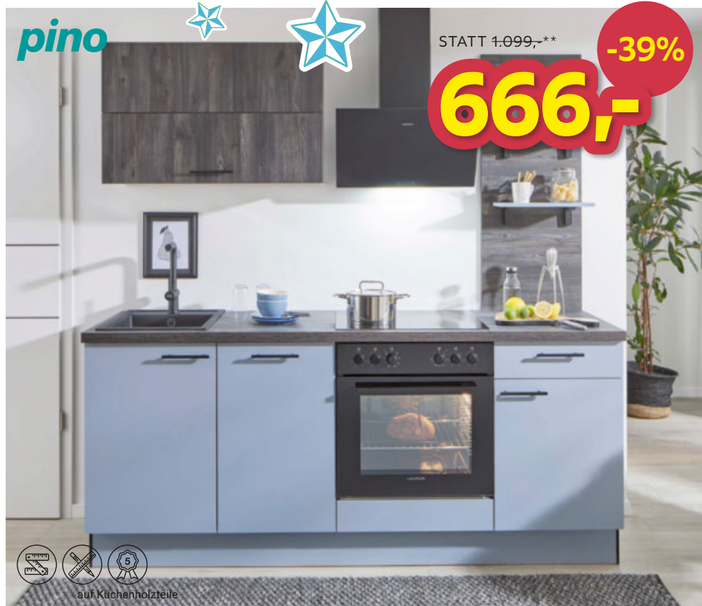
KÜCHENBLOCK, ca. 205cm, ohne Geräte, ohne Spüle 666,- (22370532/05)