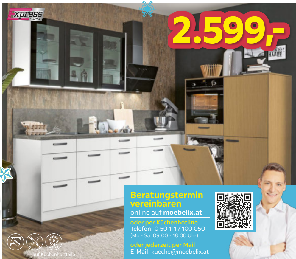
ECKKÜCHE, ca. 287/190cm, ohne Geräte, ohne Spüle 2.599,- Aufpreis für Nischenverkleidung und Beleuchtung (18710460/01;0459/01-02;0460/02)