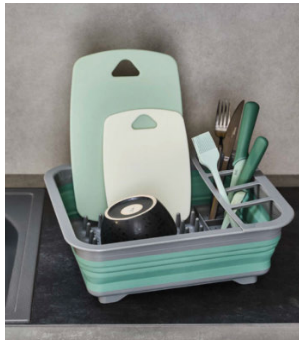
Rührschüssel , Kunststoff, mint, ca. 3 l 73110047/01 1) petrol, ca. 5 l 73110047/02 1) Schneidebrett , Kunststoff, faltbar, ca. 41 x 22 x 10 cm 73110050 1) Geschirrabtropfkorb , Kunststoff, ca. 36 x 12 x 31 cm 73110044 1)