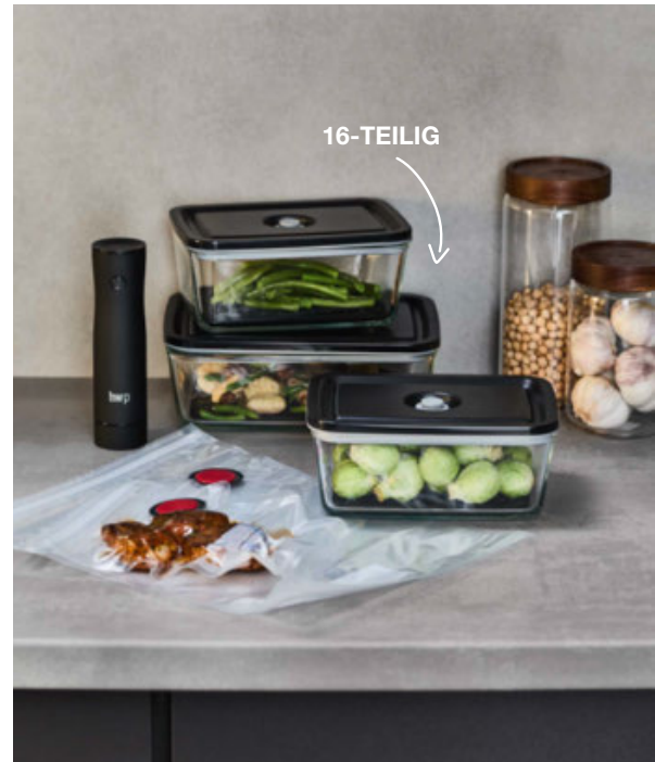
Topf-Set „Turin“ , Aluminiumguss, schwarz, induktionsgeeignet, mit Glasdeckeln, Fleischtöpfe, ca. 20 und 24 cm Ø, Gemüsetopf, ca. 16 cm Ø, und 2x Pfannenschutz 68760180/02 1) Vakuumier-Set , Kunststoff/Glas, batteriebetrieben, je 1 Vakuumierpumpe, 3 Vorratsdosen und 12 Vakuumierbeutel 83030002 1)