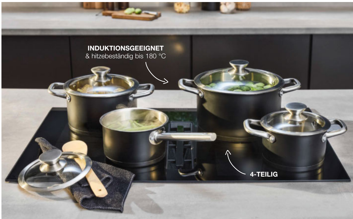
Topf-Set „David“ , Edelstahl, schwarz, mit Innensklierung, mit Glasdeckeln, Fleischtöpfe, ca. 16, 20 und 24 cm Ø, und Stielkasserolle, ca. 16 cm Ø 65930070 1)