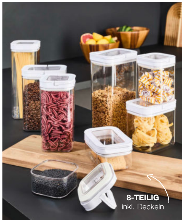
8-TEILIG inkl. Deckeln