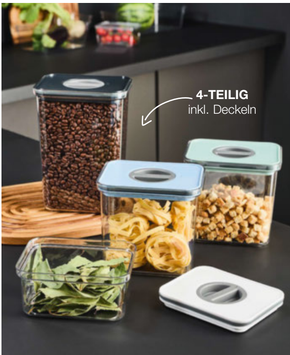
4-TEILIG inkl. Deckeln