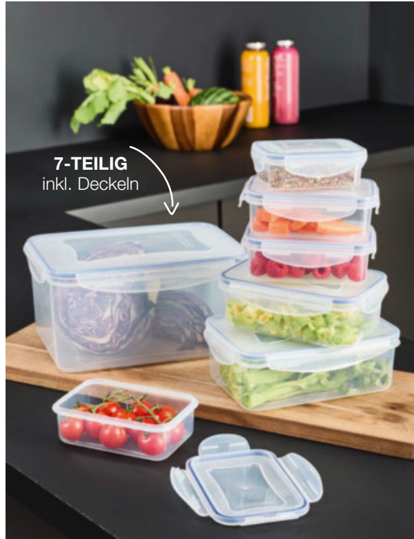
7-TEILIG inkl. Deckeln