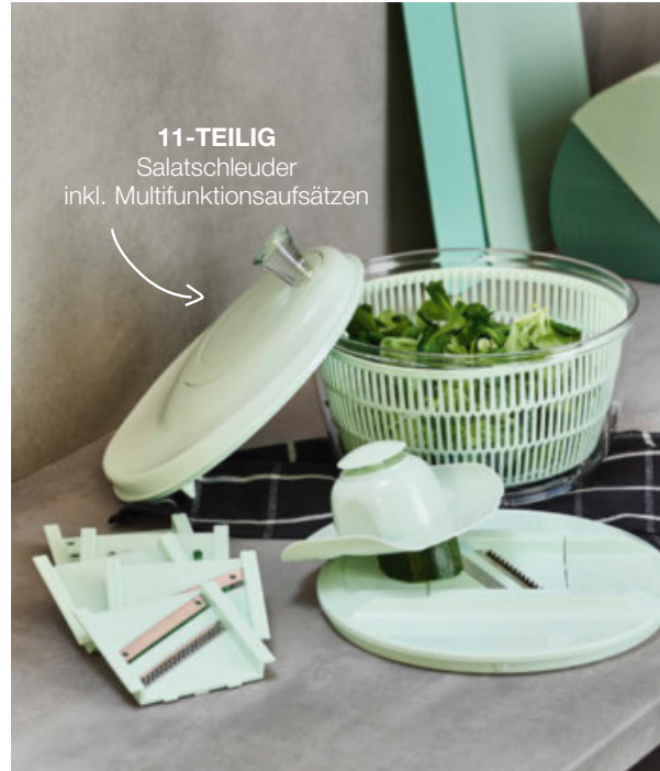
Apfelteiler , Kunststoff/Edelstahl 73110041 1) Zitronenpresse , Kunststoff, ca. 11 x 18 x 14 cm 73110042 1) Messer-Set , Edelstahl mit Kunststoffgriff, Universalmesser, ca. 13 cm, Santokumesser, ca. 18 cm, Schälmesser, ca. 9 cm, und Brot- und Chefmesser, je ca. 20 cm 73110043 1) Schneidebrett-Set , Kunststoff, mit Griff 73110048 1) Salatschleuder-Set , Kunststoff, je 1 Salatschleuder und 6 Multifunktionsaufsätze 83030015 1)