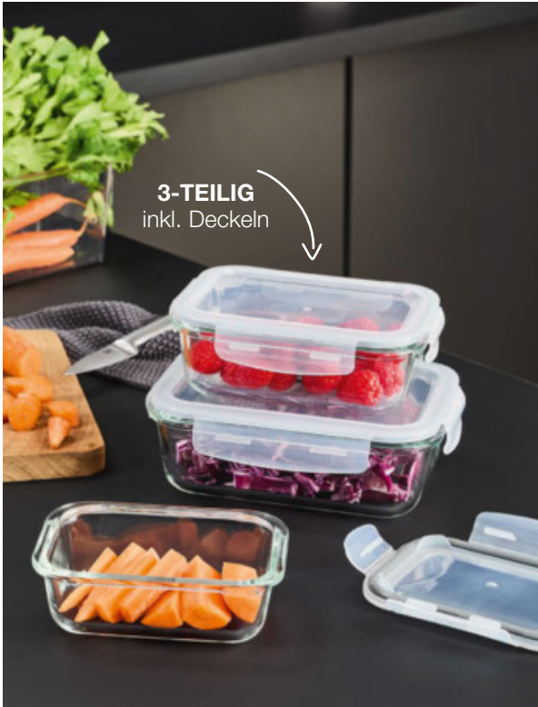
3-TEILIG inkl. Deckeln